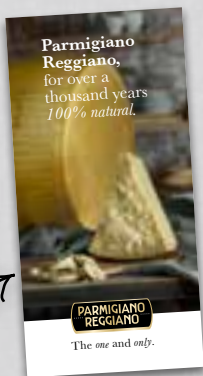
opuscolo "100% Natural"