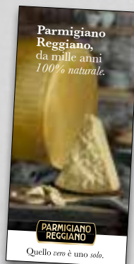
opuscolo "100% Naturale"