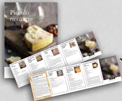
piccolo ricettario "Parmigiano Reggiano"